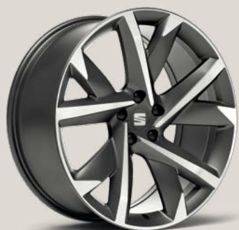
Supreme Cosmo Grey FR