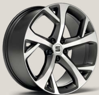
Cosmo Grey FR