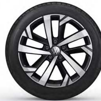
16" Lichtmetalen velg 'Torsby'