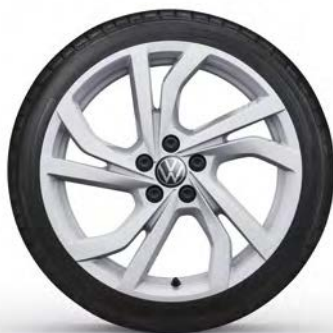
17" Lichtmetalen velg 'Tortosa'