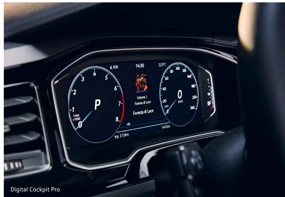
Digital Cockpit Pro

Achter het stuur van de nieuwe Polo vind je de Digital Cockpit van 20,5 centimeter. Hier zie je onder andere je snelheid en kilometerstand. Wil je nog meer? Dan kies je voor de Digital Cockpit Pro. Die is met 26 cm nét iets groter en volledig aanpasbaar naar jouw wensen. Zo kun je bijvoorbeeld ook de routebeschrijving of extra informatie van assistentiesystemen weergeven.