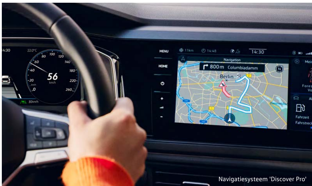
Navigatiesysteem 'Discover Pro'