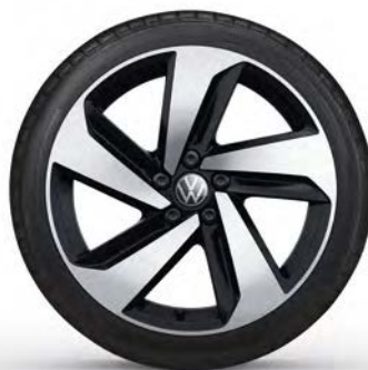
17" Lichtmetalen velg 'Milton Keynes'