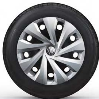
15" Stalen velg 'Tortosa'

Optioneel op de Polo en standaard op de Polo Life