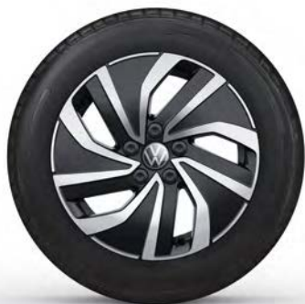
15" Lichtmetalen velg 'Essex'

Optioneel op de Polo en standaard op de Polo Life