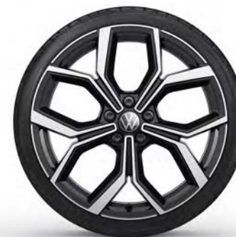
18" Lichtmetalen velg 'Faro'