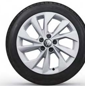
16" Lichtmetalen velg 'Palermo'