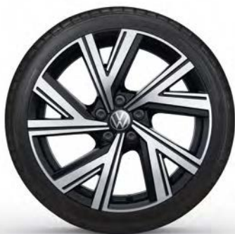
17" Lichtmetalen velg 'Bergamo'