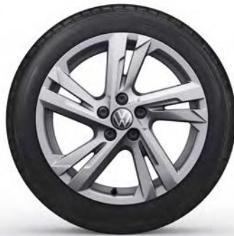
16" Lichtmetalen velg 'Valencia'